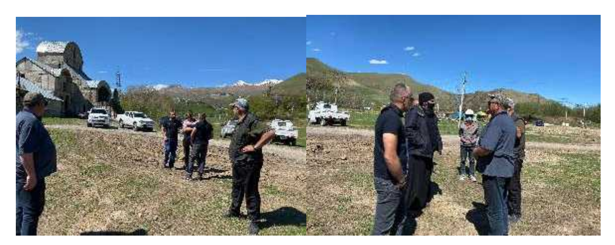
Figure 2: Photos of the public consultation meeting (May 20, 2021)