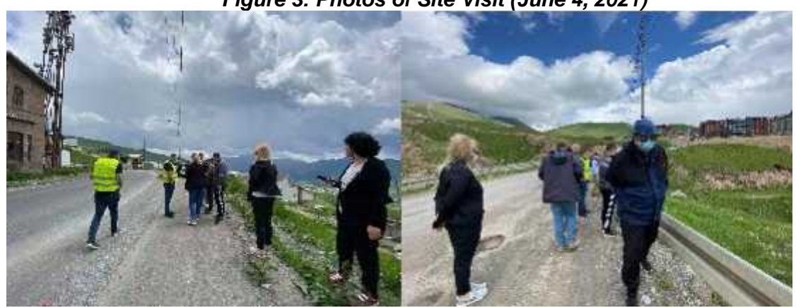
Figure 3: Photos of Site Visit (June 4, 2021)

41. On June 4, Representatives of UWSCG Social Department, Construction Company implementing the project and project supervisors visited all construction areas in order to check and monitor ongoing construction works.